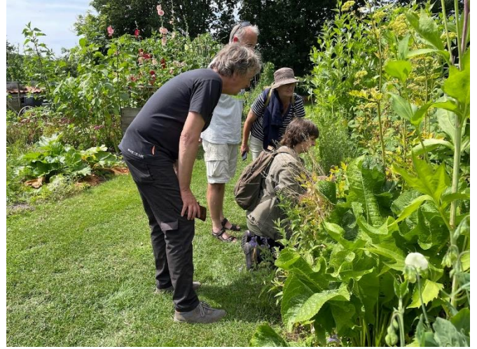
Inventariseren in de TVEO moestuin