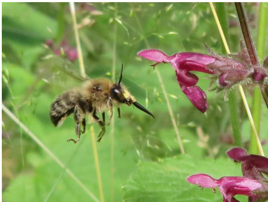
Op de app worden de prachtigste foto's uitgewisseld. Zoals deze, de zeldzame Adoornbij

Inmiddels is het ons duidelijk dat de WA Hoeve voor natuurvorsers een bijzonder interessant terrein is met veel diversiteit aan landschap en soorten.