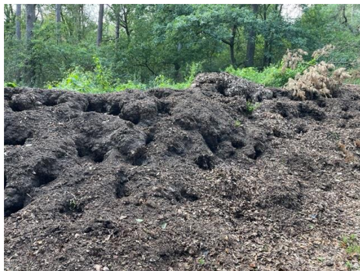
Hier zijn duidelijk de dassen op zoek geweest.