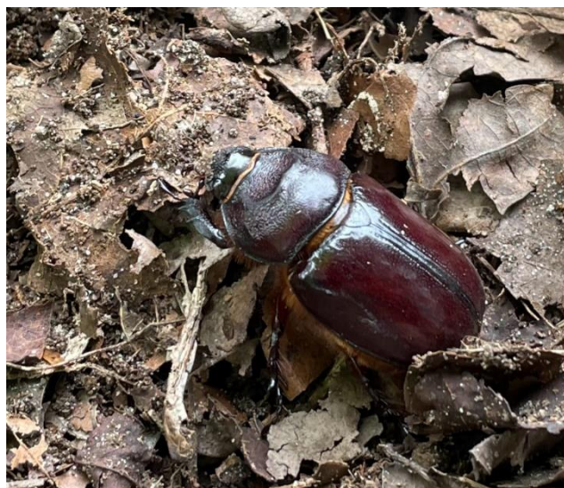
Neushoornkever, vrouwtje, voedsel voor de das.