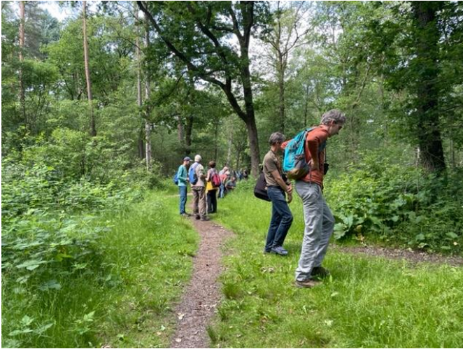
Heel veel insecten